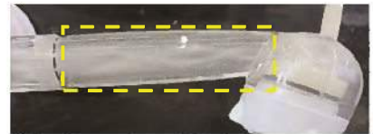
【トルネード水流の仕組み】

※計測:サイエンス性エクスプローラ「アベレージ」(TAY) (2020年) ※単位:個/cm 3 (2020年)