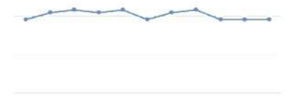
【水道27度時消費量0.46pmによる節水効果の結果】

※節水率: 100%消費水量を基準として計算されています。消費水量は使用条件により異なります。